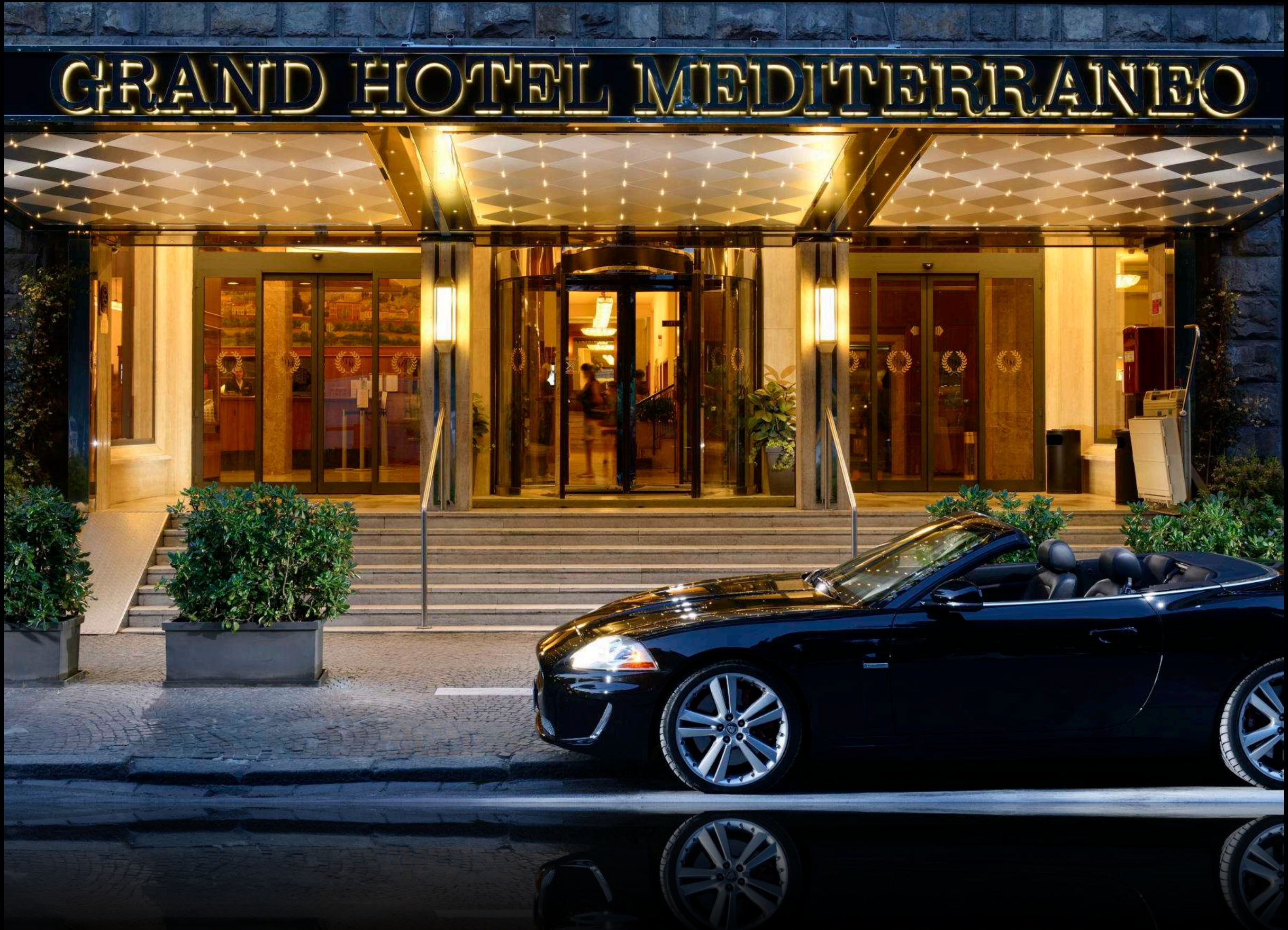
Grand Hotel Mediterraneo Lungarno del Tempio 44 Firenze